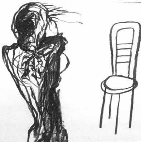
Stolica II, 2000./ Chair II, 2000.