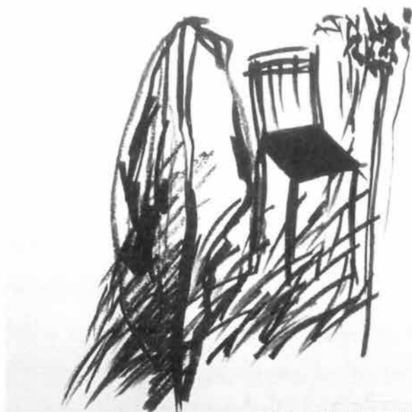
Stolica IV, 2000./ Chair IV, 2000.

This is an exhibition of part of my work during the last five years. It includes different ways of expression: rough tar drawings where the chair appears as a partner of solitude, tiny oil canvases with men and their environment, works on paper where finger prints and foot prints take in symbiotic way the place of brushes, and huge bare linen.