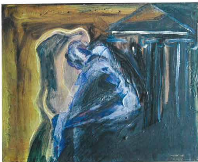
Themenos, 2000./Themenos, 2000.