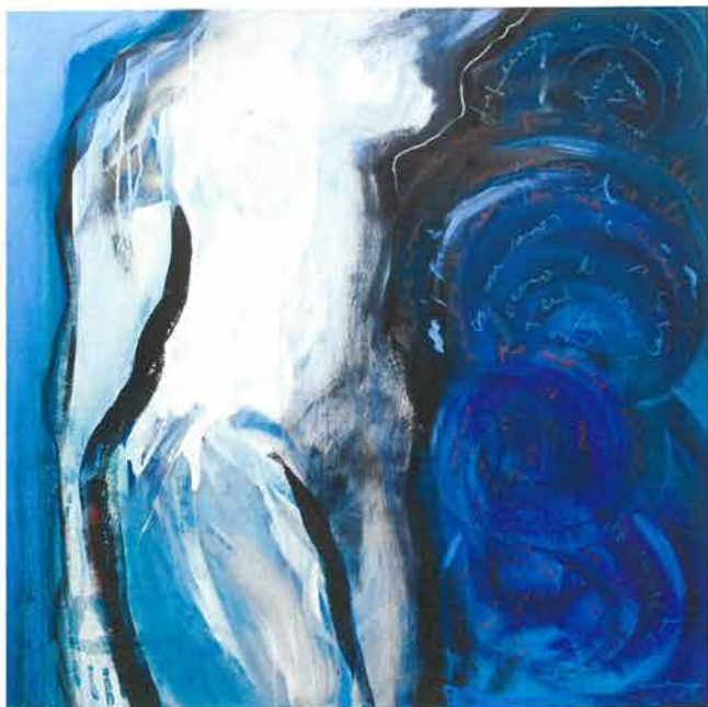
Atlantski ocean, 2005./ Atlantic Ocean, 2005.