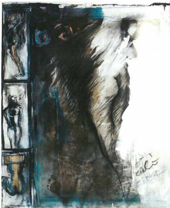
Nebo, 2002 / Cielo, 2002.

Koprivnica (Hrvatska), Galerija Koprivnica