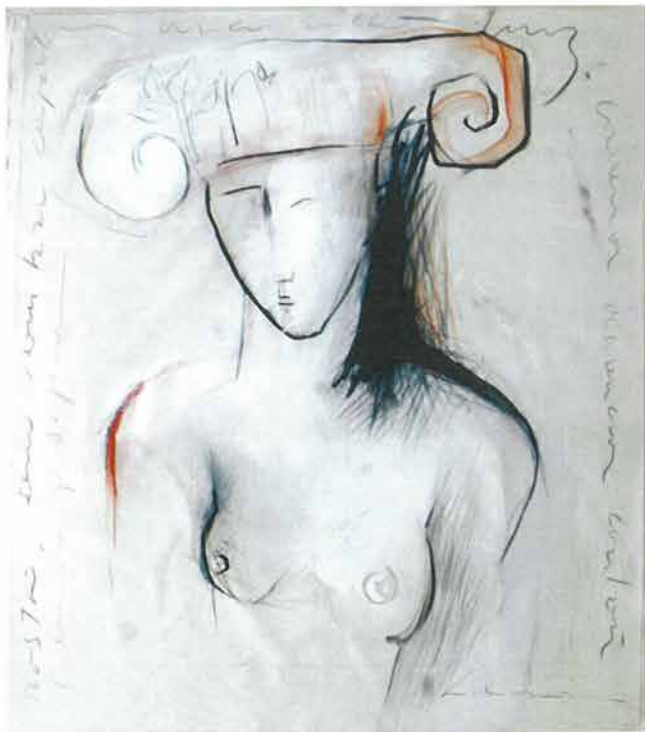
Karijatida sepija, 2004./ Sepia Caryatid,2004.

Materials of that works are often mixed media: oil, acrylic, charcoal and even tar.