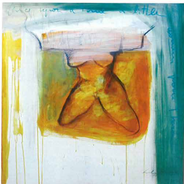
Žena iz There, 2005. / Woman from Thera, 2005.