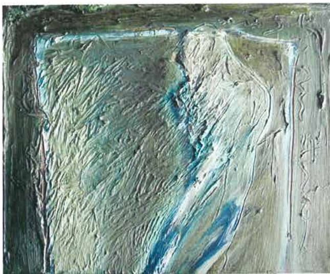
Figura s tirkizom, 2000./ Figure with turquoise, 2000.