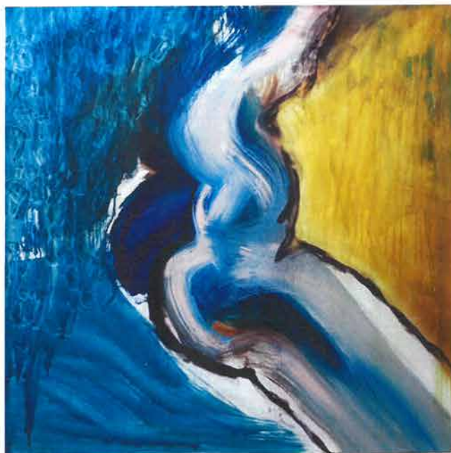
Mediterransko more, 2005./ Mediterranean Sea, 2005.

The choice of the opus in one exhibition presents the artist in the best or in the truest manner. The paintings exhibited today are a sample by which one recognizes the painter Liliana Livneh in the modern world of art.