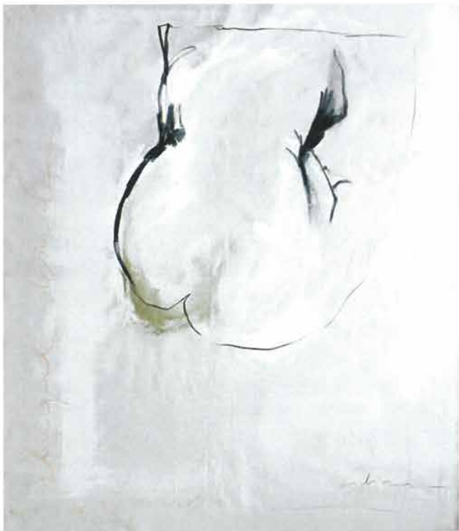
Detalj torza, 2005./ Torso detail, 2005.